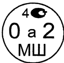
Рисунок 4.1. Знак поверки государственного регионального центра метрологии