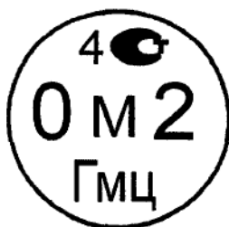
Рисунок 4.2. Знак поверки государственного научного метрологического института